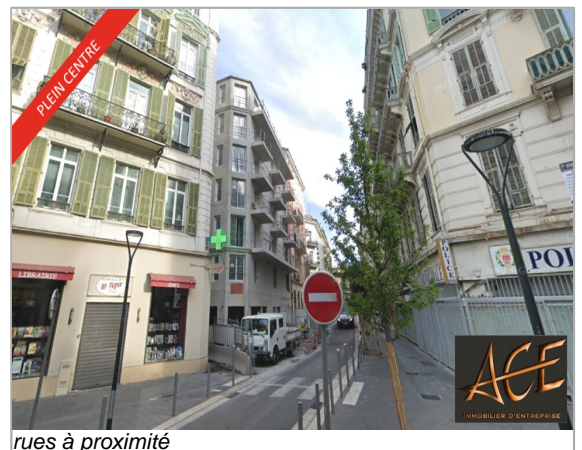
rues à proximité