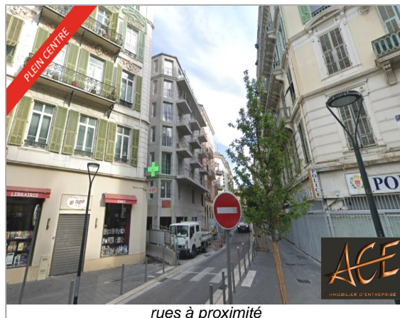
rues à proximité