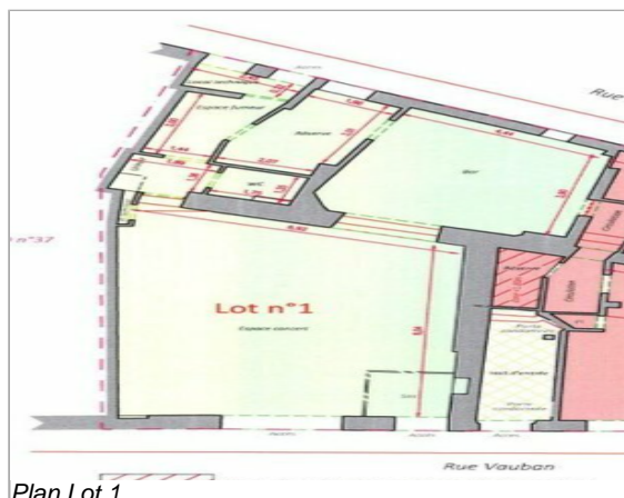
Plan Lot 1